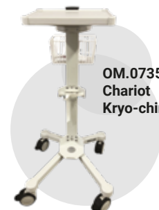
OM.0735.903 Chariot Kryo-chirurgie