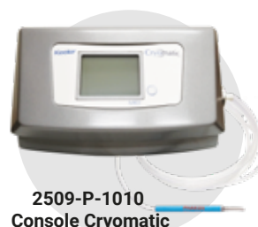
2509-P-1010 Console Cryomatic

MV AD93 Adaptateur Frigitronics CE2000 MV AD94 Adaptateur Dorc cryostar MV AD95 Adaptateur Dorc 1500 MV AD98 Adaptateur keeler cryomaster I MV AD96 Adaptateur keeler cryomaster II MV AD97 Adaptateur erbe / optikon